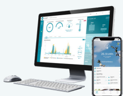
Suite logiciel MyLight Systems