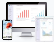
Suite logiciel MyLight Systems